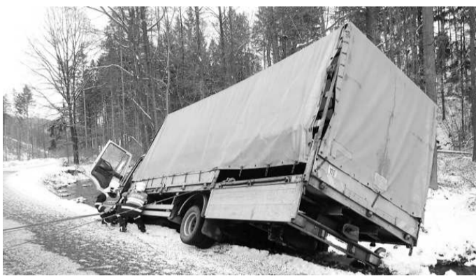
ZÁSAHY. Hasiči tento týden pomáhali při několika nehodách.