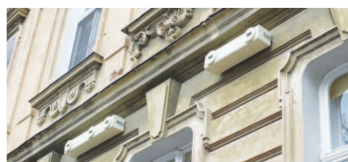
NÁHRADNÍ BUDKY. Majitelé domu v olomoucké Resselově ulici s pomocí ornitologů upevnili na fasádu náhradní budky pro rorýse místo hnízdišť, o která přišli při opravě domu.

Střední Morava – Zateplováním paneláků přicházejí rorýsi obecní, ale i jiné ptačí druhy o tradiční hnízdiště. Podobně při rekonstrukci ve starší zástavbě, například domu v centru Olomouce, kde ale majitelé nechali upravit otvor po odvětrání kuchyně a dutinu ve zdivu, která rorýsům posloužila v loňské hnízdní sezoně. Nakonec ještě pořídili speciální budky jako náhradu za zaniklá hnízdiště, které jim ornitologové pomohli upevnit poblíž otvorů.