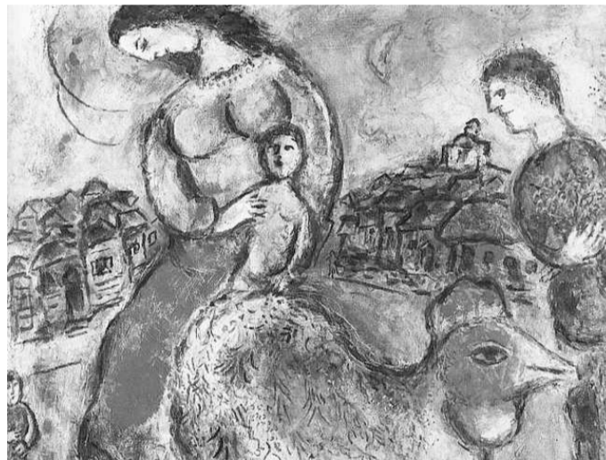
UKÁZKA z tvorby Marca Chagalla.